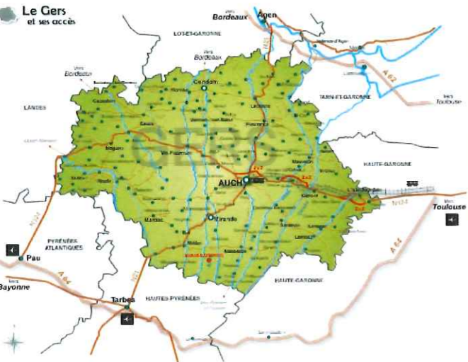
Plan de situation MANAS-BASTANOUS, commune du GERS