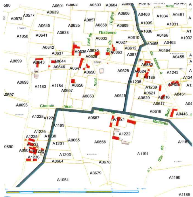
Plan au 1/2000ème du village de Manas